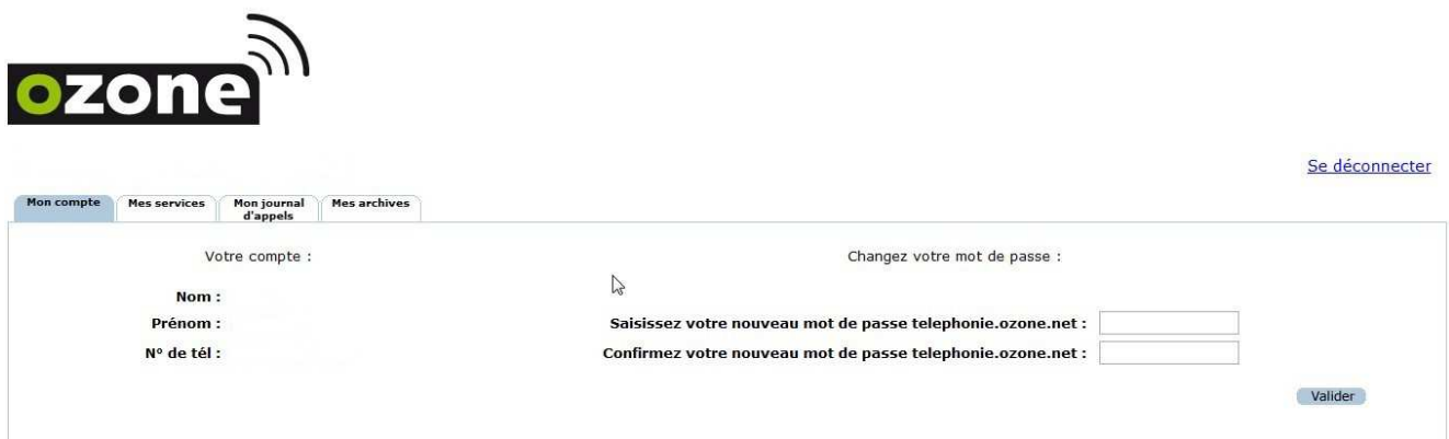
Écran d'accueil avec résumé du compte et changement de mot de passe

Le premier onglet « Mon compte », celui sur lequel on arrive par défaut après s'être authentifié, rappelle les informations du compte et offre la possibilité de changer son mot de passe d'accès à l'interface.